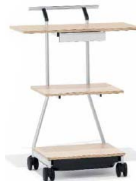
手推车（放置投影仪等）