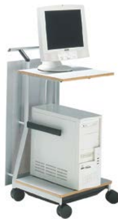
手推车（放置电脑等）